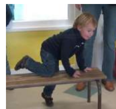
En posant le genou

A la fin de cette étape, les élèves sont engagés sur un progrès moteurs, une transformation.