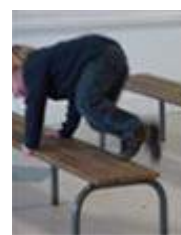
En posant le pied