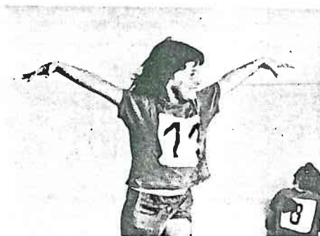
Des intentions et des intérêts aux réponses authentiques il y a un cheminement complexe : celui de l'activité de l'enfant.