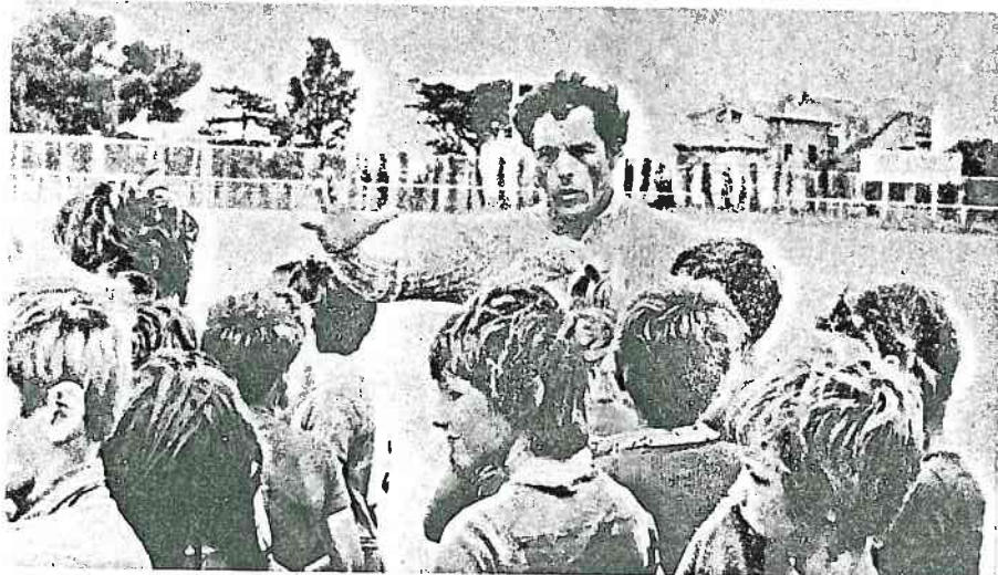
Au départ d'une situation pédagogique : les intentions de l'animateur face aux intérêts des enfants.

A l'option fondamentale : « la psychologie de l'enfant peut multiplier les données de faits et nos connaissances sur le mécanisme du développement ; ces faits ou ces idées ne rejoindront jamais l'école si les maîtres ne les ont pas incorporés jusqu'à les traduire en réalisations originales ». (Piaget-« Psychologie et Pédagogie »).