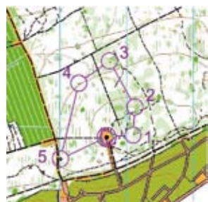
Cartes 3 et 4 Avec les chemins

La carte, support essentiel de la CO va être une variable prépondérante sur laquelle on va jouer pour proposer des exercices d'apprentissage.