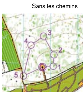
Sans les chemins

Par exemple, supprimer les chemins pour que l'élève ne se base que sur le relief pour s'orienter ou encore limiter les données sur la carte pour apprendre à faire une lecture simplifiée des éléments (et donc gagner du temps).