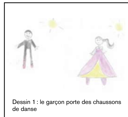
Dessin 1 : le garçon porte des chaussons de danse

La danse est une activité artistique, qui reste très fortement connotée, notamment du fait du cliché de la danse classique = « filles en tutu ». D'autre part, les pratiques extra-scolaires attirent très majoritairement et véhiculent souvent des normes sociales de genre. En choisissant la danse, nous souhaitons qu'avec le langage du corps, les filles et les garçons puissent s'exprimer et acceptent de se mettre en scène en mixité devant les autres, que la façon de mener et vivre les séances n'active aucun stéréotype et ne génère aucune moquerie.