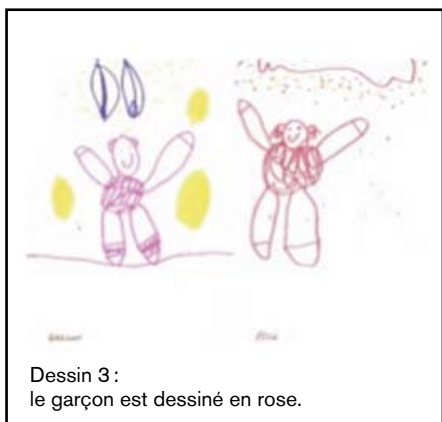
Dessin 3 : le garçon est dessiné en rose.