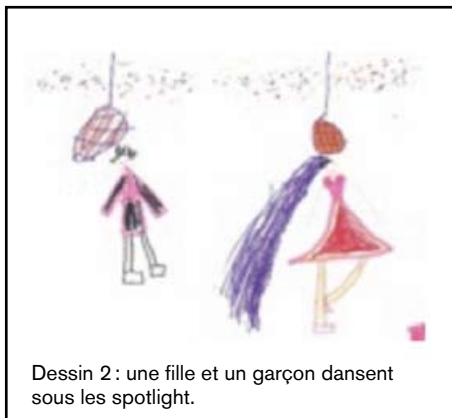
Dessin 2 : une fille et un garçon dansent sous les spotlight.

Ingrid : Après avoir mené ensemble un cycle de rugby et de cirque, le choix de la danse s'est fait suite au constat que les élèves de CE2 pensent qu'il y a des APSA « pour les filles » et d'autres « pour les garçons ». Même si certain·es font prévaloir la pratique d'activités « pour tout le monde » et que la grande majorité pense que « la danse, c'est aussi pour les garçons »... ils/elles ne souhaitent pas la pratiquer à l'école ! Nous avons donc décidé de mener un cycle avec des élèves de CP, avec l'objectif de contre-carrer les stéréotypes sexués dans cette activité dès le plus jeune âge. Pourquoi les enfants rejettent-ils la pratique la danse ?